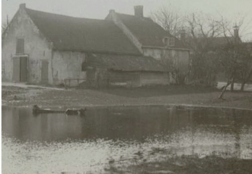
Hofstede Het Paradijs in 1914, kort voor de sloop