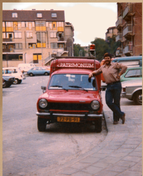
'Op de wagen' bij Patrimonium