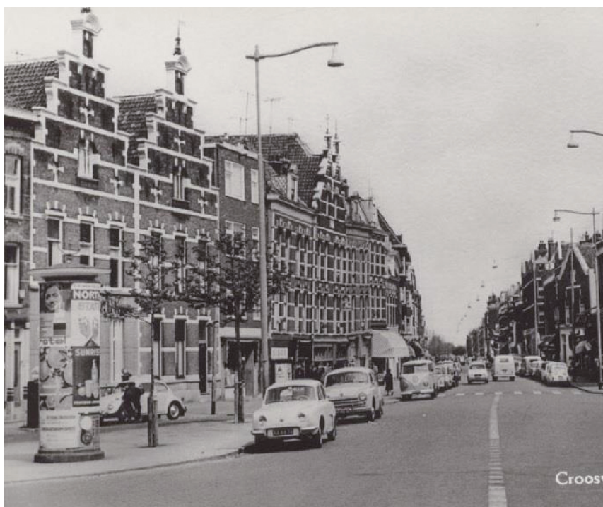
De Crooswijkseweg in de jaren zestig. Veel panden zijn gesloopt tijdens de stadsvernieuwing

In deze rubriek nemen we Crooswijk op de korrel en gaan we op zoek naar die rijke geschiedenis en anekdotes over vroegere wijkgenoten. Deze keer: de Crooswijkseweg