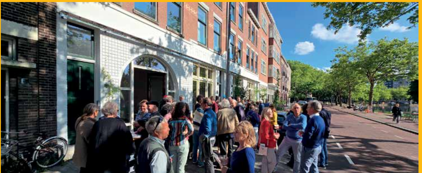
Tientallen bewoners, ondernemers en andere betrokkenen bezochten bij het Man met Bril Hotel het laatste Rottecafé