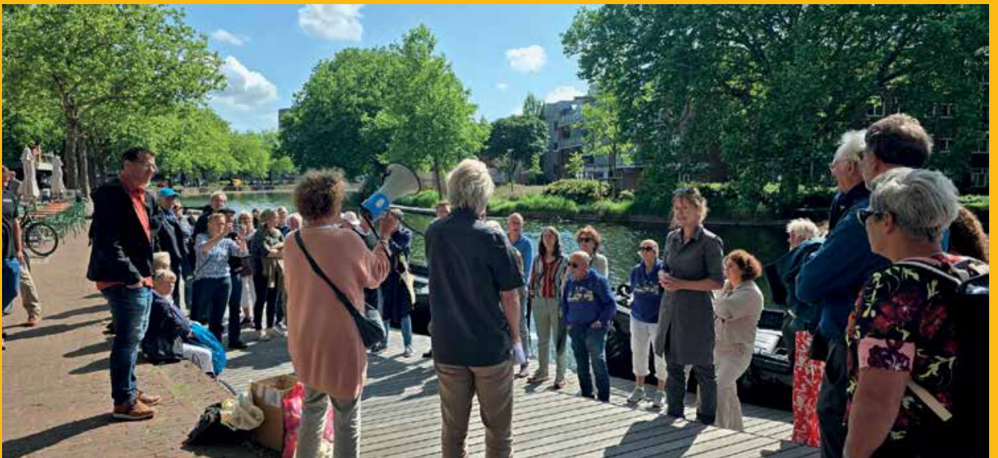
Een stokje als aanmoediging voor het werk van De Rotte Plasticvrij.