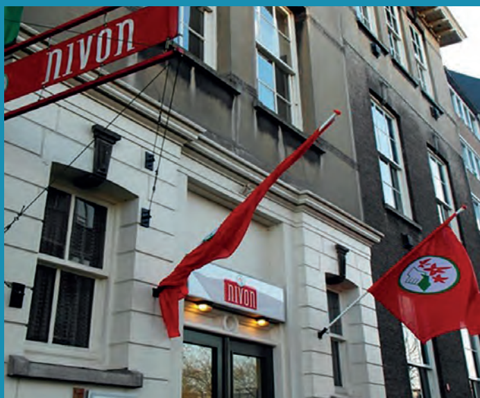
De voorgevel in de Dirk Smitsstraat, onveranderd sinds 1910

Het oudste nog bestaande schoolgebouw van Crooswijk staat aan de Boezemsingel. Je zult het echter niet meer als een school herkennen want de eerste school van Crooswijk, gebouwd in de jaren zeventig van de negentiende eeuw, werd al in de Tweede Wereldoorlog in gebruik genomen als politiebureau. In 1955 volgde een uitgebreide verbouwing om er ook echt een politiebureau van te maken en het pand heeft nog steeds het aanzien van 1955, al is het sinds enkele jaren een appartementengebouw.