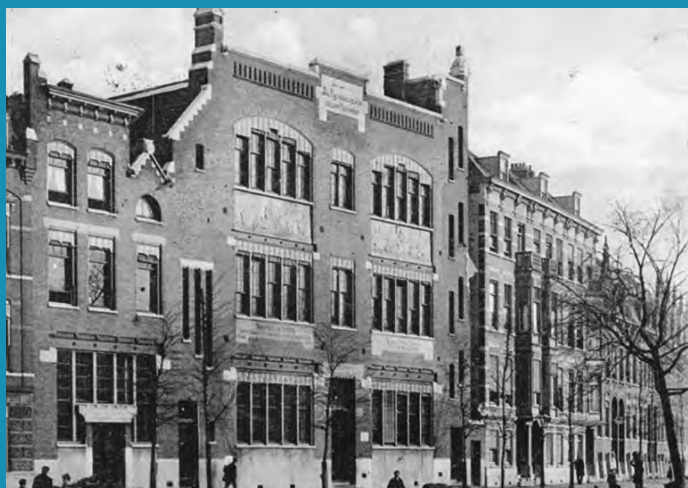
De Koningin Wilhelminaschool in 1900, kort na de bouw en nog met de oorspronkelijke gevel

Door naar het op tweede oudste schoolgebouw dan maar. Ook dat ziet er niet meer uit zoals na de bouw, maar oogt nog steeds als een schoolgebouw. Het is het oude schoolgebouw in de Dirk Smitsstraat 76, tegenwoordig het Nivon-centrum. Oorspronkelijk werd de school kort voor 1880 gebouwd als school voor 'gewoon lager onderwijs', een plaquette in de voorgevel herinnert daar nog aan. Door het stijgende aantal kinderen in de wijk werd het gebouw in 1910 ingrijpend verbouwd en voorzien van een tweede verdieping. Ondanks latere verbouwingen is er nog veel uit 1910 bewaard gebleven, zeker aan de buitenzijde maar ook in het interieur.