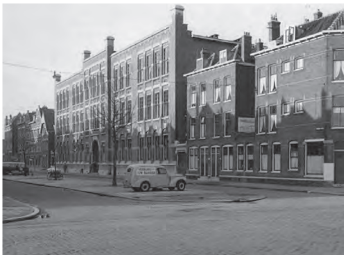
De Lagere Technische School in 1959

In 1909 werden maar liefst twee scholen gebouwd die nog steeds bestaan: de Lagere Technische School in de Tamboerstraat en het schoolgebouw in de Haverlandstraat. De Technische School was een waar hoogstandje, qua omvang en uiterlijk. Tegenwoordig is het Rudolf Steiner college er gehuisvest, waardoor het gebouw weer een schoolfunctie heeft.