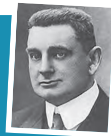
A.S. Talma

Hoewel de A.S. Talmaschool geen historisch pand meer heeft en in een vrij modern gebouw is gehuisvest, heeft deze school toch een historisch jaar: het 100-jarig bestaan wordt dit voorjaar gevierd!