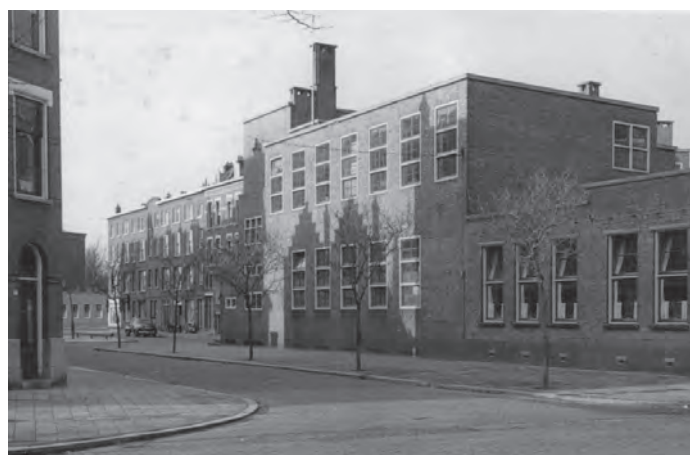
De oude Talmaschool in 1959, gezien vanaf de Nieuwe Boezemstraat

Dat roept de vraag op wie A.S. Talma eigenlijk was. Aritius Sybrandus Talma (1864-1916) speelde begin twintigste eeuw een belangrijke rol bij de invoering van sociale wetgeving. Hij had oorspronkelijk een theologische opleiding gevolgd bij de Universiteit Utrecht en werd predikant. Talma zag de slechte omstandigheden waarin arbeiders leefden en werkten en werd politiek actief door zich aan te sluiten bij het Christelijk Sociaal Congres en de Anti Revolutioinaire Partij van Abraham Kuyper. Vanaf 1901 zat hij in de Tweede Kamer en in 1908 werd hij minister van Landbouw, Nijverheid en Handel, een positie die hij tot 1913 behield. In 1910 kwam een arbeidswet tot stand die de positie van vrouwen en kinderen verbeterde en in 1913 volgde een invaliditeitswet. Talma overleed in 1916 en maakte dus de gevolgen van zijn wetgeving nauwelijks meer mee. Zijn naam leefde echter voort in de naamgeving voor meerdere instellingen, waaronder dus ook de A.S. Talmaschool in Crooswijk.