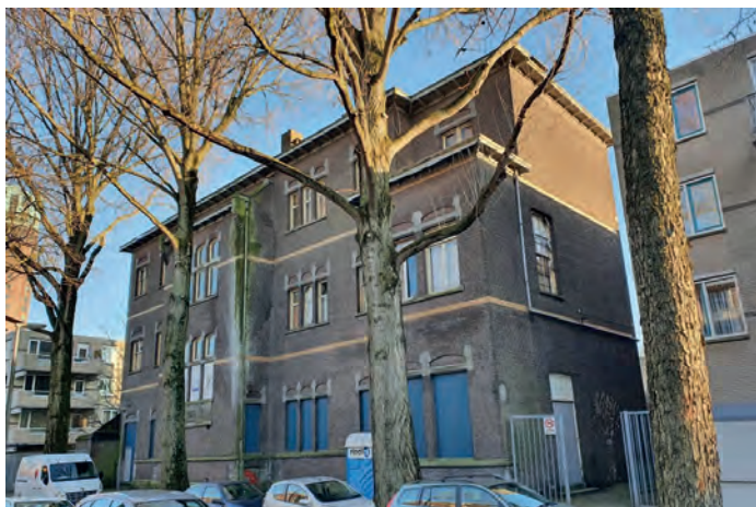
Het schoolgebouw voor de verbouwing tot appartementen

Eveneens in 1909 kwam de school in de Haverlandstraat tot stand. Oorspronkelijk was ook dit een basisschool. Na de oorlog werd de school gebruikt voor de Lagere Tuinbouwschool, tot hiervoor een nieuw pand bij het Kralingse Bos werd gebouwd. De school in de Haverlandstraat werd vervolgens nog gebruikt voor muziek- en balletonderwijs van het Rotterdams Conservatorium. Na een lange periode van leegstand werd het gebouw enkele jaren geleden verbouwd tot woningen, waarbij het uiterlijk behouden bleef.