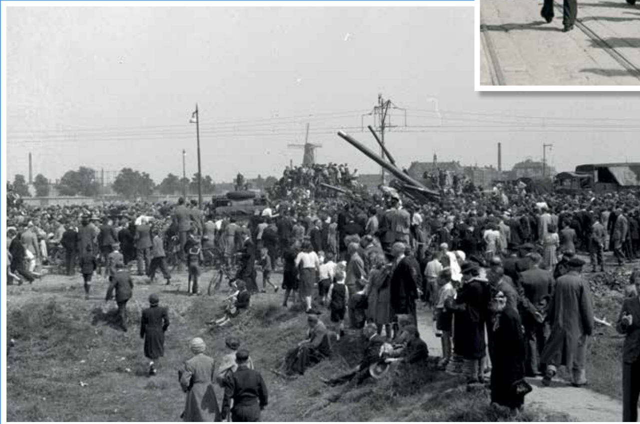
Mensen kijken bij de Mariniersweg naar passerende Canadese voertuigen.