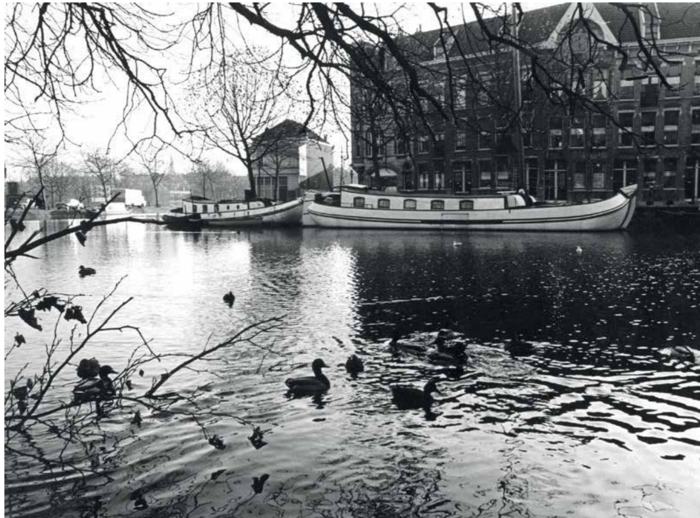
Een tjalk in de Rotte in 1975. Een dergelijk schip werd in 1945 gebruikt als wapenopslagplaats voor de Rotterdamse KP

Aan de Crooswijksebocht ligt begin 1945 een oude tjalk, 'De Drie Gebroeders'. Wat niemand weet, is dat die tjalk door het verzet in Rotterdam wordt gebruikt als opslagplaats voor wapens. Maar dan is er plotseling een Duitse overval op het schip. Er zijn twee verzetsstrijders aan boord.