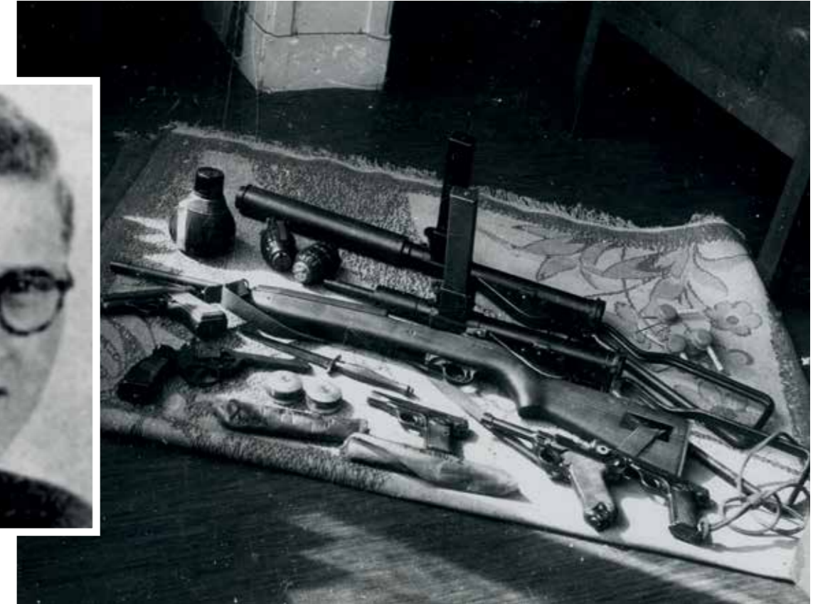
Wapens zoals die tijdens de oorlog door het verzet werden gebruikt