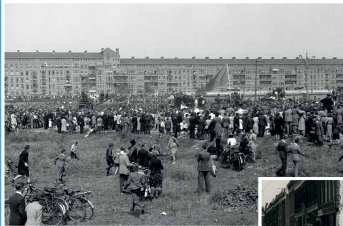
Menigte bij de Goudsesingel bij het wooncomplex Wereldhave, in afwachting van een colonne van de bevrijders.