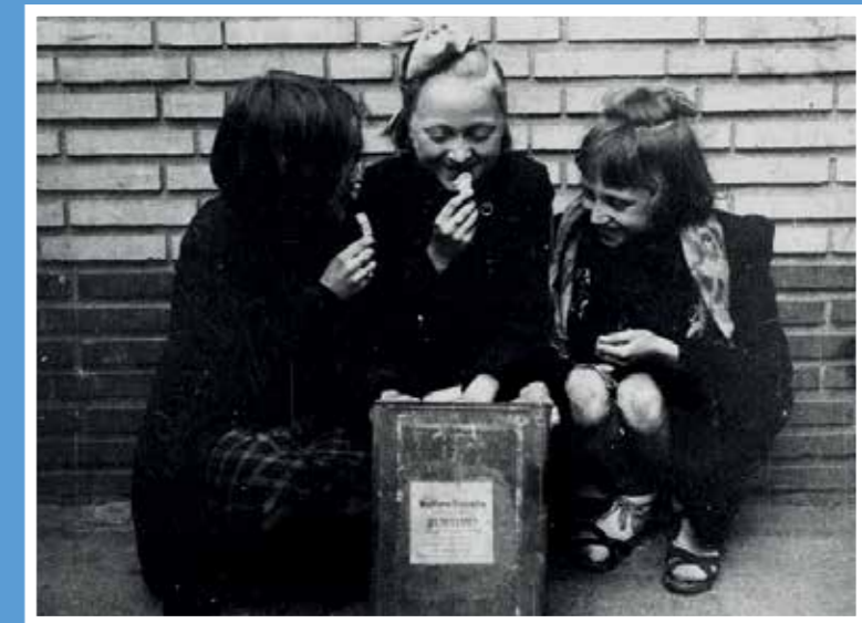
Meisjes eten uit een blik biscuits na de voedseldroppings van de geallieerden, voorjaar 1945.