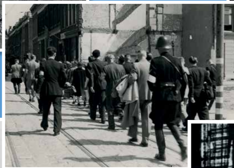
Leden van de NSB worden na de bevrijding weggevoerd over de Linker Rottekade.