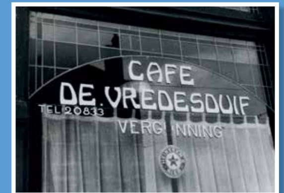
Cafe De Vredesduif aan de Boezemstraat 87.