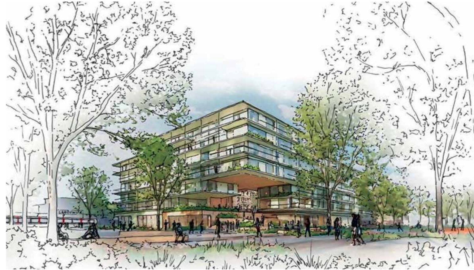
Impressie van de nieuwbouw op het Schuttersveld (afbeelding B1Design en Venhoeven CS)

Menig Crooswijker is er weleens geweest: het oude zwembad c.q. sporthal op het Schuttersveld. Is het niet met schoolzwemmen, dan heb je er als ouder wel langs de kant gestaan tijdens diplomazwemmen. Of wellicht heb je er recent wel een vaccinatie gehaald.