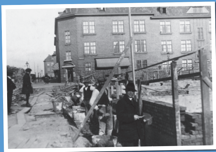
Woningbouw in de omgeving van de Rusthofstraat, 1923

De 'Slurf' bestaat uit woningen aan de Rusthofstraat en de Paradijslaan. Dit complex is een deel van Nieuw Crooswijk en daarvoor kijken we terug naar ruim honderd jaar geleden. Rond 1900 waren de wijken Rubroek en Oud Crooswijk geheel bebouwd. De stad breidde zich nog steeds uit en daarom werd in 1913 een uitbreidingsplan gemaakt, dat voorzag in bebouwing in het noordelijkste deel van Crooswijk. Dat werd Nieuw Crooswijk, een wijk met destijds veel modernere woningen dan in Oud Crooswijk.