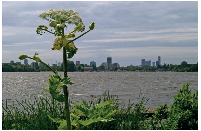
Uitzicht op Crooswijk vanaf de Kralingse Plas

In 1928 begon de eerste aanplant aan de oostkant van de plas. Na de jaren dertig werd aan de westkant het strandbad aangelegd. Maar door de crisistijd en de Tweede Wereldoorlog duurde het nog tot 1953 voor het bos helemaal klaar was en het hertenkamp werd geopend. Het bos ontwikkelde zich sindsdien tot een ongekend populair recreatie- en natuurgebied dat tegenwoordig miljoenen bezoekers per jaar trekt. En voor Crooswijkers is het natuurlijk praktisch 'om de hoek'!