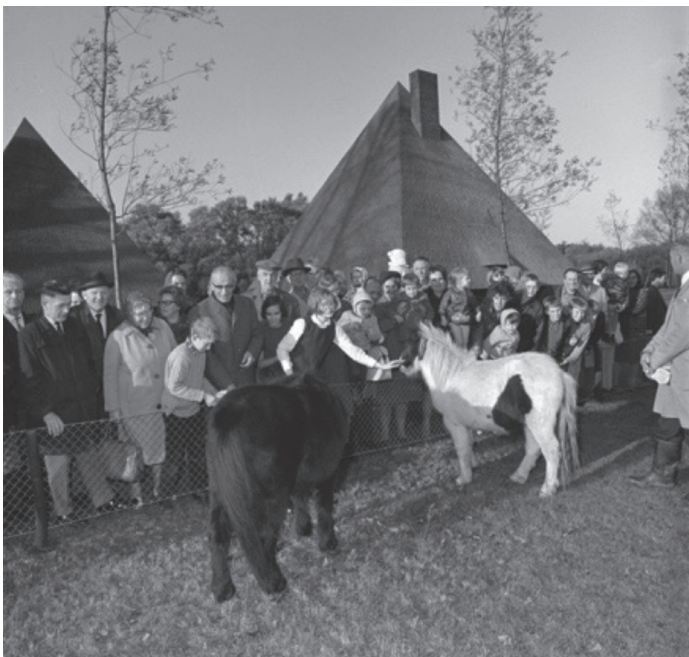
Opening van de kinderboerderij in 1967

'Het Kralingse Bos is er voor alle Rotterdammers'