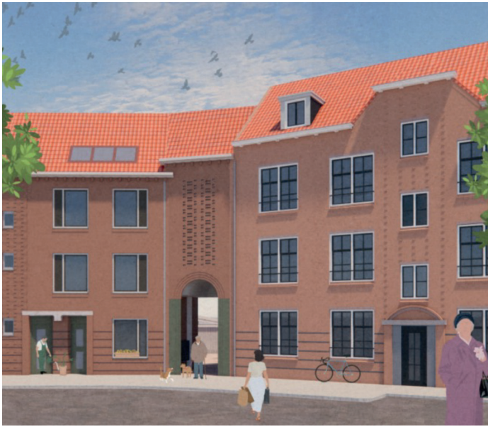
Artist impression van de 'Slurf' na de renovatie