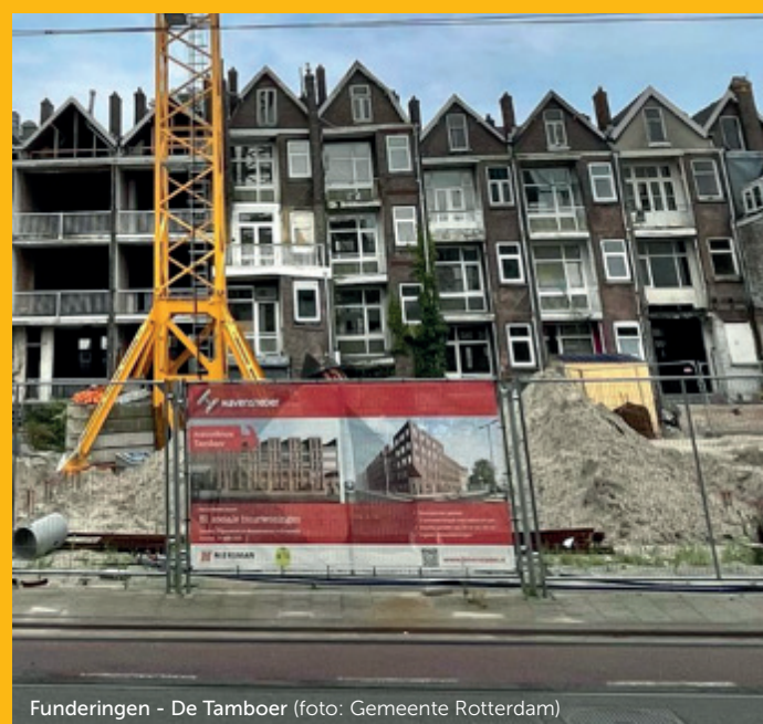
Funderingen - De Tamboer