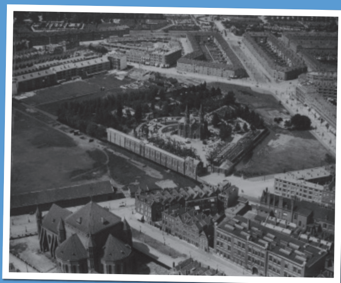
Luchtfoto uit 1923, met in het midden achteraan duidelijk zichtbaar de net gebouwde 'Slurf'