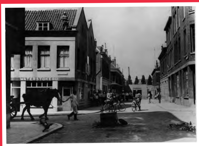
Huisraad op straat, een omver gehaalde lantaarnpaal en militaire politie in de Rubroekstraat getuigen van de onrust in Crooswijk.