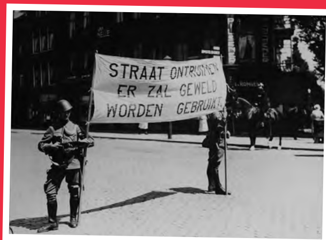
Militaire politie bewaakt in juli 1943 de Crooswijkseweg.