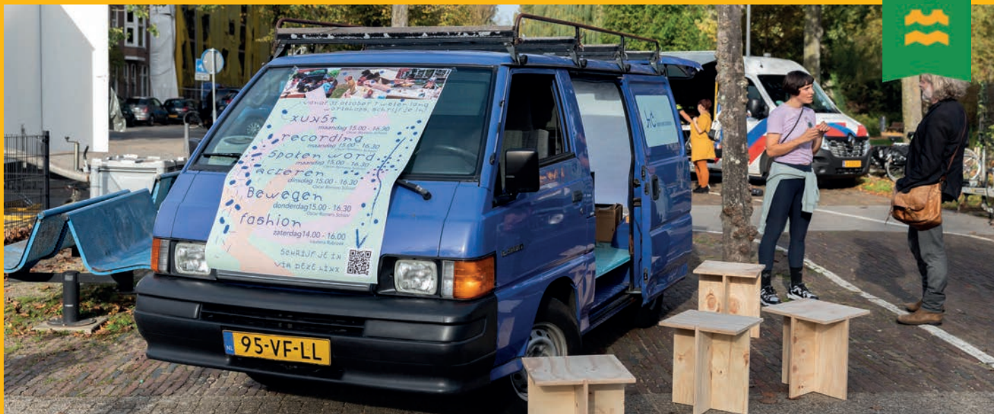
De Kunstbus tijdens Crooswijk op Stelten