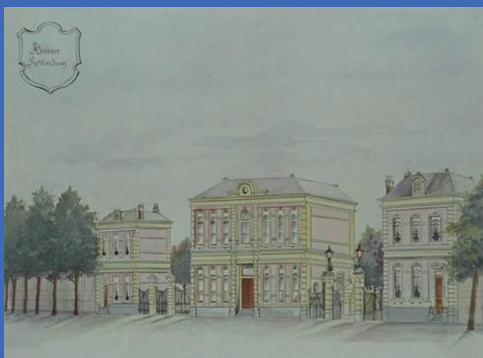
Tekening van de drie nog bestaande poortgebouwen aan de Boezemstraat (Stadsarchief Rotterdam)

De hele 'Slachthuisbuurt', zoals de woonbuurt bij de Boermarke wordt genoemd, kent straatnamen die naar vee of het vroegere slachthuis zijn genoemd. Rotterdam had al in de Middeleeuwen een veemarkt, die in het centrum van de stad plaatsvond. In de negentiende eeuw werd de stad steeds groter en werd er naar een nieuwe locatie gezocht. Uiteindelijk verhuisde de veemarkt in 1867 naar Rubroek. Bij de plannen voor die verhuizing was in 1864 rekening gehouden met de bouw van een abattoir bij de veemarkt. De markt en het abattoir zouden dan een complex vormen. Het Stadsarchief Rotterdam heeft een schetstekening uit 1865 waarop zo'n complex is te zien. Op een tekening uit 1876 is dat abattoir echter nog steeds een plan en geen realiteit.