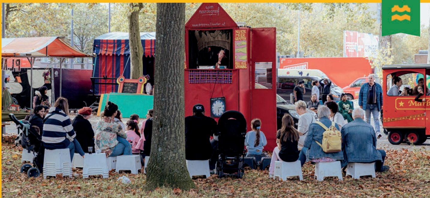
Crooswijk op Stelten