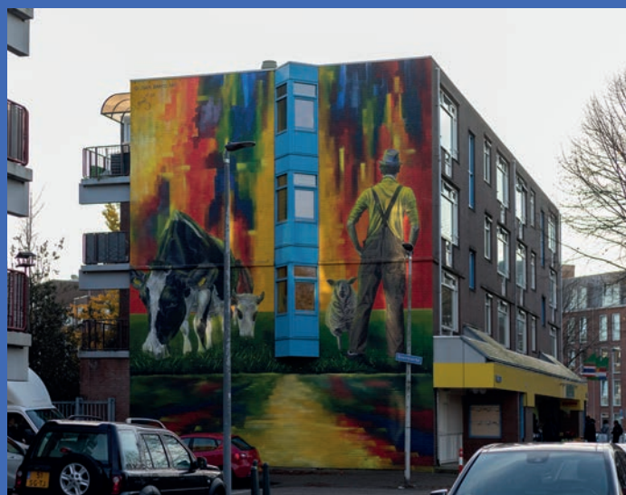
De muurschildering aan de Boermarke

Als erkenning voor de zo lang bestaande veehandel en slachterij in Crooswijk krijgen alle straten in de nieuwe buurt de naam van vee of het slachtbedrijf. Zo kent de 'Slachthuisbuurt' straatnamen als Koeweide, Schapendreef, Vleeshouwerstraat en ook Boermarke, waar nu de muurschildering is aangebracht.