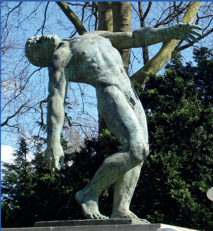
De Vallende man bij vak P op de Algemene Begraafplaats Crooswijk.

De Algemene Begraafplaats Crooswijk kent een groot aantal kunstwerken, die doorgaans in het teken van afscheid of verdriet staan. Het beeld van een man in een vallende houding staat bij vak P, een ereveld voor gesneuvelde militairen. Dit veld werd op 30 mei 1940 ingewijd, met op dat moment de graven van 110 Nederlandse militairen die waren gesneuveld bij de verdediging van Rotterdam. Later kwamen hier nog vijf graven bij.