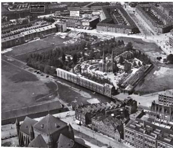
Op deze luchtfoto uit 1923 is de omvang te zien van de St. Laurentius begraafplaats, en dus ook van de voormalige buitenplaats Groenendaal. Groenendaal lag tussen de Nieuwe Crooswijkseweg en het einde van de arcademuur op de voorgrond, en van daaruit tot de huidige Rusthoflaan (rechts op de foto). Er bestaan helaas geen afbeeldingen van de buitenplaats en het huis dat er heeft gestaan.

Op een plattegrond uit de negentiende eeuw is te zien waar de buitenplaats precies lag en hoe groot het gebied was. In de notariële akte uit 1855 werd gesproken over '90 roeden en 16 ellen'. Dat komt overeen met de Laurentius begraafplaats, die in 1869 werd geopend. De begraafplaats beschikte over een zeer grote (in 1962 gesloopte) kapel, die met haar twee torens in de wijde omgeving was te zien. Tegenwoordig is de grens van de begraafplaats nog grotendeels hetzelfde als in 1869. Alleen aan de achterzijde is de begraafplaats later uitgebreid, de grens lag daar aanvankelijk pal achter de kapel. Over de Laurentius begraafplaats zullen we in De Crooswijker zeker nog eens uitgebreider schrijven.