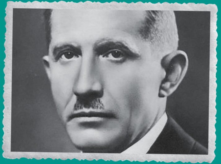
Portret van Konovalts

Jevgen Konovalts groeide op in Galicië, een landstreek in het westen van het huidige Oekraïne die begin 20 e eeuw nog bij Oostenrijk-Hongarije hoorde. Na de Eerste Wereldoorlog viel Oostenrijk-Hongarije uiteen en ontstond een poging om een onafhankelijke staat Oekraïne op te richten. Een poging die mislukte toen de Sovjet-Unie het gebied van die beoogde staat opslokte. Een aantal Oekraïense nationalist bleef desalniettemin proberen om, in ballingschap, een onafhankelijk staat na te streven. Jevgen Konovalts was zo'n nationalist. Hij woont in de jaren dertig in Rome en wordt beschouwd als de leider van de nationalistische beweging. In mei 1938 neemt hij een nachttrein naar Rotterdam, waar hij in de ochtend van 23 mei aankomt bij Station Maas. Zijn doel: een ontmoeting met een vermoedde medestander in Hotel Atlanta aan de Coolsingel. Konovalts neemt vanaf het station een taxi naar Hotel Centraal aan de Kruiskade, waar hij een kamer huurt. Rond de middag vertrekt hij van daaruit naar het dichtbij gelegen Hotel Atlanta. Konovalts krijgt een pakje van de man die hij daar ontmoet en wandelt na de bespreking het hotel uit, de Coolsingel op. En dan vindt er een zware explosie plaats. Het pakje blijkt een bom te hebben bevat, Konovalts is op slag dood.