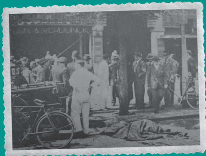
Konovalts vermoord op Coolsingel

De politie stelt een 79 pagina's dik rapport op over de spectaculaire aanslag en komt tot de conclusie dat de moordenaar iemand is die de naam 'Waluch' gebruikte. Konovalts was overigens op reis met een Duits paspoort en gebruikte zelf de schuilnaam Josef Novak. De dader werd niet meer gevonden en Konovalts werd begraven op de Algemene Begraafplaats Crooswijk. Zijn grafsteen draagt het symbool van de nationalistische beweging waar hij de leider van was. Pas na het uiteenvallen van de Sovjet-Unie wordt bekend wie 'Waluch' was. Een voormalig lid van de Russische geheime dienst, Pavel Soedoplatov, bekende dat hij destijds in opdracht van Stalin de aanslag had gepleegd. In 2006 ontstond in Oekraïne het plan om voormalige leiders op een erebegraafplaats bij elkaar te brengen. Konovalts ligt echter nog steeds begraven in Crooswijk. In Zashkiv is het geboortehuis van Konovalts tegenwoordig een klein museum, ter nagedachtenis.