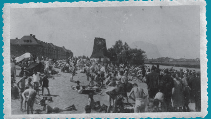
Volop strandvertier langs de Boezem.

Op een andere plek langs de Boezem, bij de Boezemlaan, kon je in de zomer zwemmen. Het buitenzwembadje is pas na de bouw van Nieuw Crooswijk ontstaan, in de jaren twintig. De foto straalt de sfeer van een waar