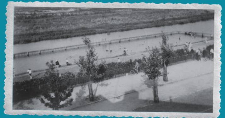
Het afgebakende bad in de Boezem, gefotografeerd vanuit een woning aan de Boezemlaan.

strandtafereel uit. Op de achtergrond zien we zowel het toen nog vrij nieuwe wooncomplex aan de Boezemlaan als de laatste molenstomp van de acht molens die tot 1899 de Boezem bemaalden. Die molenstomp geeft een indicatie over wanneer de foto moet zijn gemaakt. Het Stadsarchief dateert de foto op 1928-1932, maar de molenstomp is van de voormalige molen nr. 5 en die werd in 1926 gesloopt. De foto moet dus van voor die tijd zijn. Het is mij niet bekend tot wanneer dit keurig in de Boezem afgebakende zwembadje bestond.