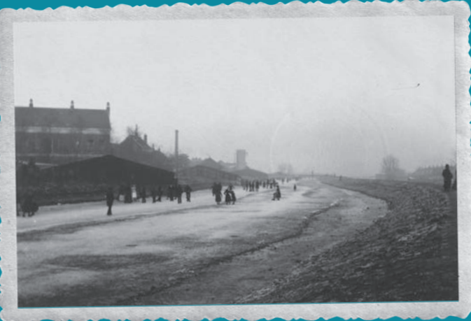
Ijspret op de Boezem. Aan de Kralingse kant moet de bouw van het wijkje Jaffa nog beginnen.

De Boezem werd zowel in de zomer als in de winter door wijkbewoners gebruikt voor recreatie. In de winter kon je, mits het stevig had gevoren, op de Boezem schaatsen. Dat gebeurde al snel na de bouw van de wijken, eind 19e eeuw. Op een foto uit de periode 1898-1902 zien we Crooswijkers massaal op het ijs bij de Slachthuisgade. De gebouwen van de school in de Boezemdwardsstraat en het gebouwtje waar tegenwoordig boksschool Van 't Hoff is gevestigd zijn duidelijk herkenbaar. Zulke ijspret verliep overigens niet altijd even lekker. Ik wandelde op jonge leeftijd halverwege de jaren zestig met mijn moeder langs de bevroren Boezem, toen plotseling de brandweer met spoed bij de Slachthuisgade arriveerde, precies op hetzelfde plekje van de foto. Er bleek een jongen door het ijs te zijn gezakt. Door de stroming was hij onder de ijsvloer afgedreven en moest de brandweer vlakbij de Boezembrug een tweede wak hakken om hem eruit te halen. In de buurt werd later verteld dat de jongen het voorval niet had overleefd, iets dat grote indruk op me maakte.