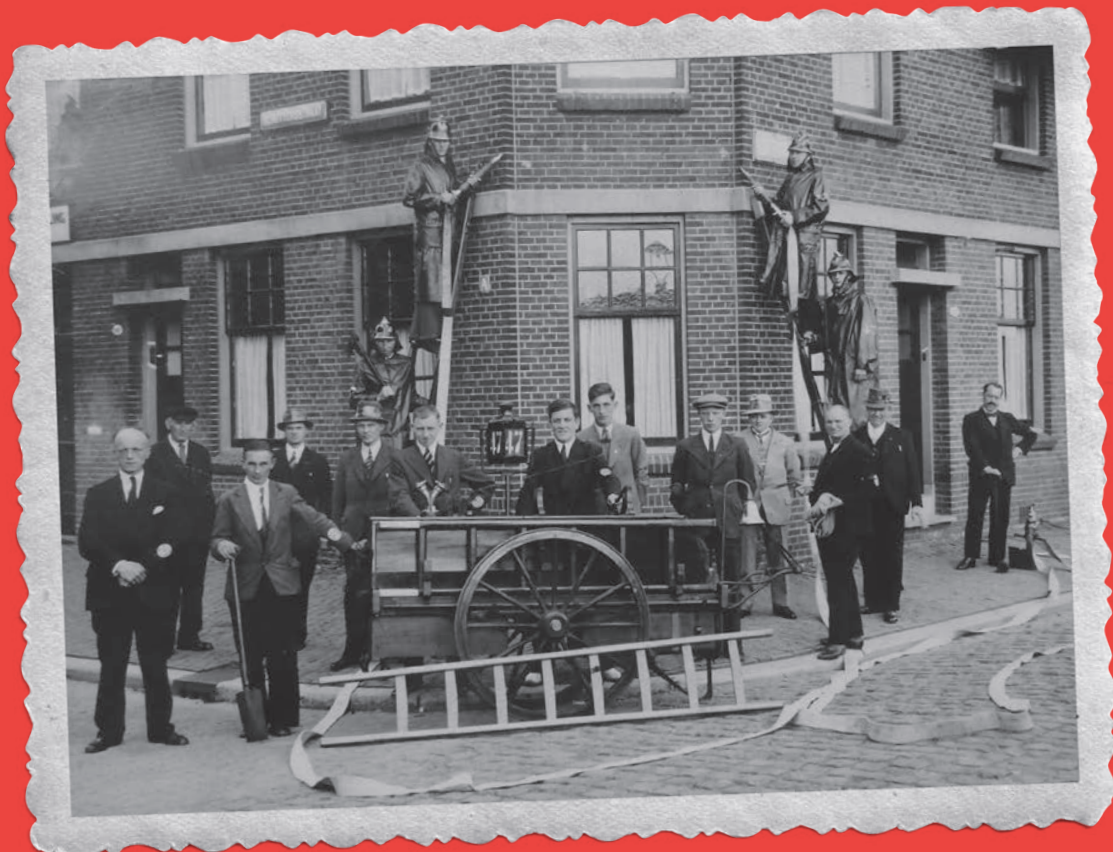
Brandweer.No 47 Schuttersweg (foto hoek Schuttersstraat)

In de jaren dertig verandert het materieel van de brandweer aanzienlijk. De gemeente heeft zeven zeer moderne grote Ahrens Fox brandweerauto's gekocht en de karren in de brandweershuisjes beginnen ouderwets te worden. Toch werken de blusploegen in de wijken tot in de oorlog nog door met hun karren. Zo is Slangenwagen no. 47 in mei 1943 bijvoorbeeld betrokken bij het blussen van het wrak van een bij de Nieuwe Crooswijkseweg neergestorte Short Stirling bommenwerper. Op de foto zien we de Slangenwagen no. 47 in vol ornaat, de bemanning er omheen poserend op de hoek van Schuttersweg en de Schuttersstraat. De meeste vrijwillige brandweelieden hebben hun netste burgerkloffie aangetrokken, vier andere poseren in uniform tegen de gevel.