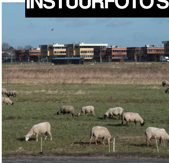
Die vacht kan er weer af!