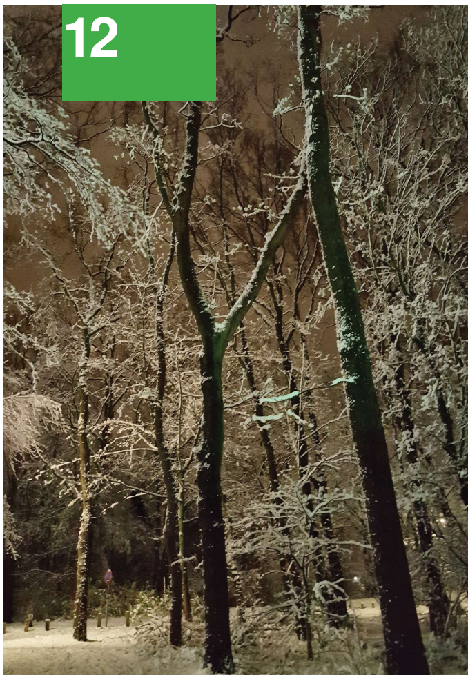
Een prachtige boom in de sneeuw van Nathalie Kappers. Zij wint de eerste plaats van deze editie!