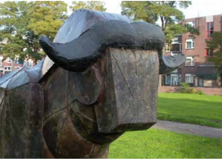
de Muskusos op de Koeweide (BKOR)

Midden op de Koeweide staat een enorme bronzen os. Het is een verwijzing naar het gemeentelijk slachthuis dat hier vroeger huisde. In de jaren tachtig veranderde Crooswijk snel door de stadsvernieuwing en de sloop van oude panden. Tegelijkertijd waren enkele grote bedrijven uit de wijk verdwenen, zoals Jamin, de Heineken brouwerij en ook het gemeentelijk slachthuis.